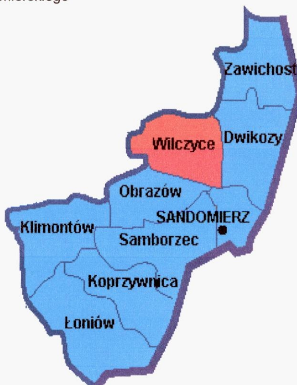
Rys. 1. Mapa powiatu sandomierskiego

Daromin – wieś w Polsce położona w województwie świętokrzyskim, w powiecie sandomierskim, w gminie Wilczyce.