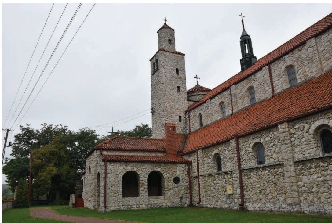
Fot. 1. Kościół parafialny p.w. Najświętszego Serca Pana Jezusa w Jankowicach Kościelnych (fot. autor opracowania).