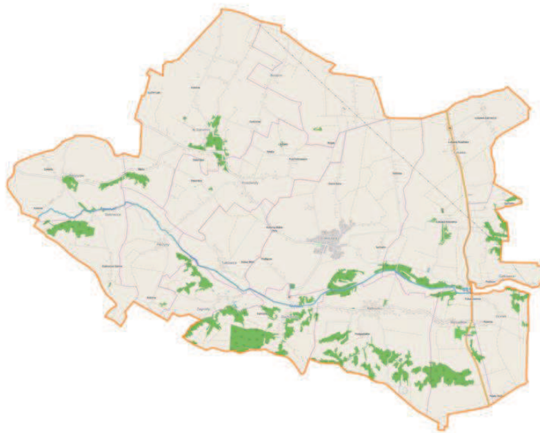
Ryc. 1. Położenie Gminy Wilczyce (źródło: materiały Gminy Wilczyce).

Gmina Wilczyce jest gminą wiejską położoną w województwie świętokrzyskim, w powiecie sandomierskim. Sąsiaduje z gminami: Dwikozy, Lipnik, Obrazów, Ożarów i Wojciechowice. Znajduje się we wschodniej części Wyżyny kielecko-sandomierskiej, w dolinie rzeki Opatówki, w pobliżu miasta Sandomierz, w odległości ok. 90 km od Kielc, będących największym miastem regionu i jednocześnie miastem wojewódzkim. Siedzibą gminy są Wilczyce.