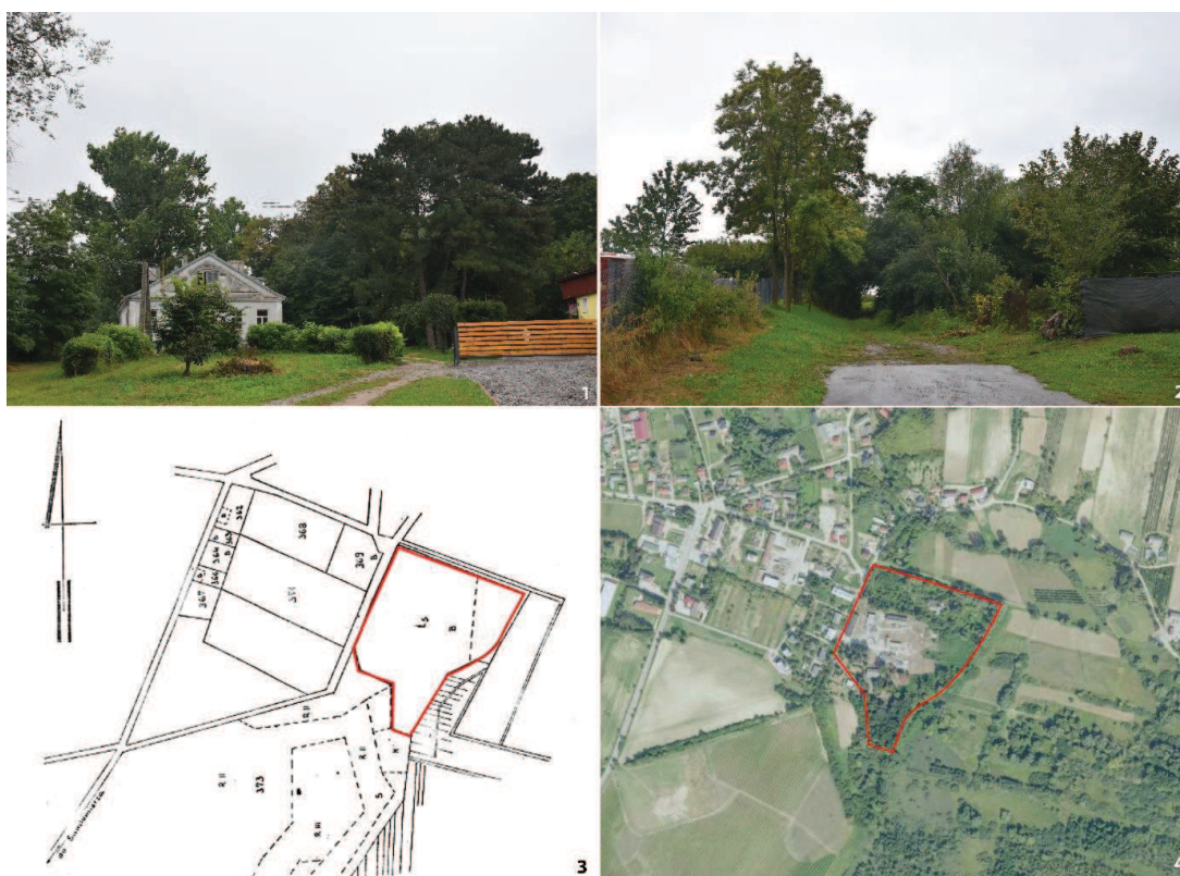
Fot. 4. Park w zespole dworsko-parkowym z folwarkiem w Wilczycach. 1) Widok od zach.; 2) Widok od pn.; 3) Mapa, skala 1:5000, podkład: Karta parku; 4) Mapa, skala 1:5000, podkład: www.geoportal.gov.pl.