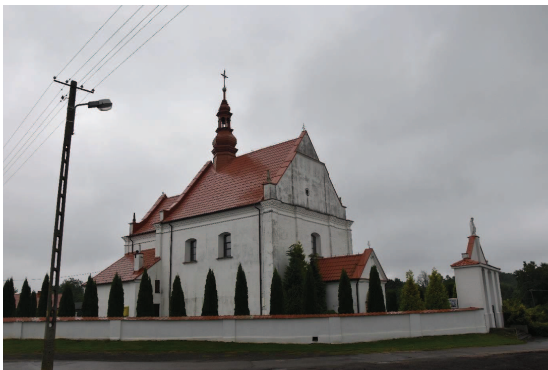
Fot. 2. Kościół parafialny p.w. św. Katarzyny w Łukawie.