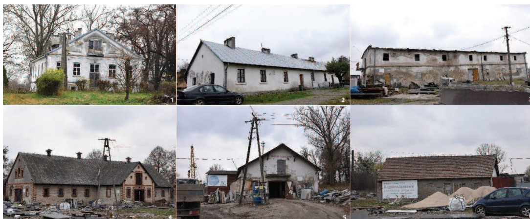
Fot. 3. Zabudowania wchodzące w skład zespołu dworsko-parkowego z folwarkiem w Wilczycach. 1) Dwór; 2) Czworak; 3) Czworak, ob. magazyn; 4) Obora; 5) Obora; 6) Magazyn.